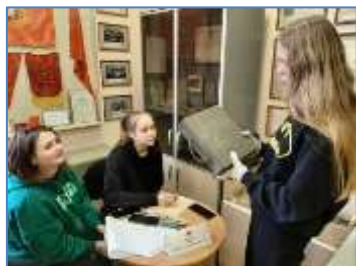
Фото занятий с учащимися 7-го и 4-го классов